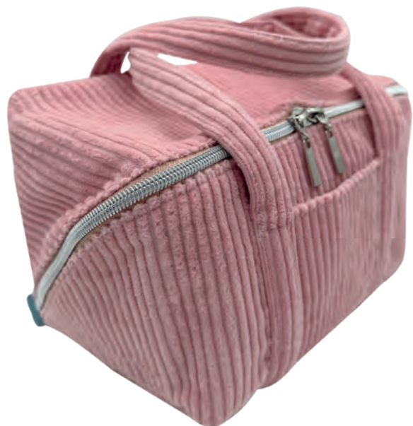
Magic-Pouch Betty von Naehnika