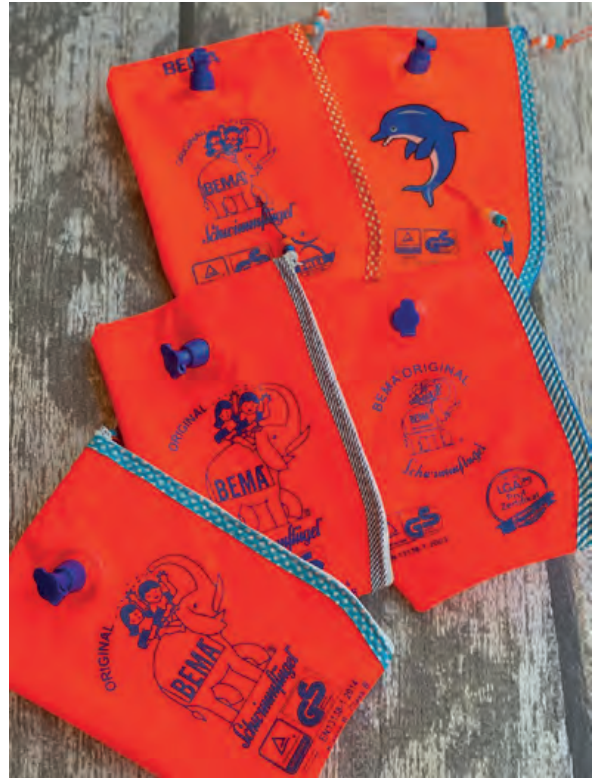
Schwimmflügel tasche von tanehansen