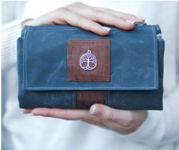
Geldbörse von Smaragd Taschen

Verkaufsstelle in Deiner Nähe finden: www.mykiosk.com