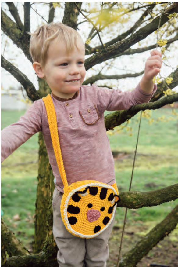
Umhängetasche Tiger von chabepatterns