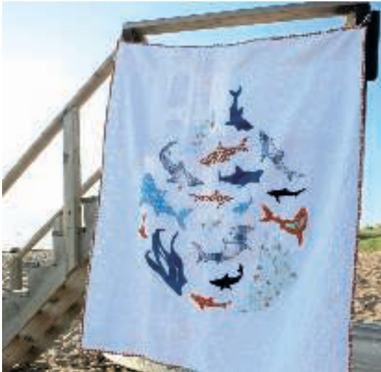
6 Casey York