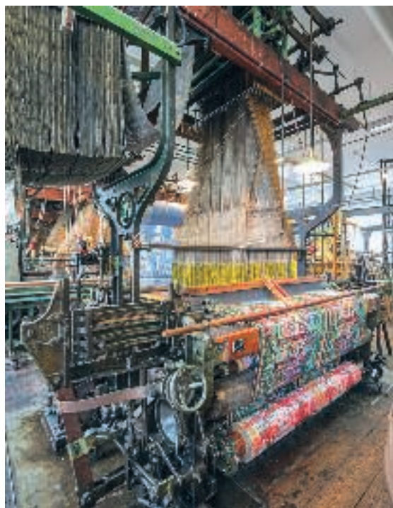
56 Tipps für Trips