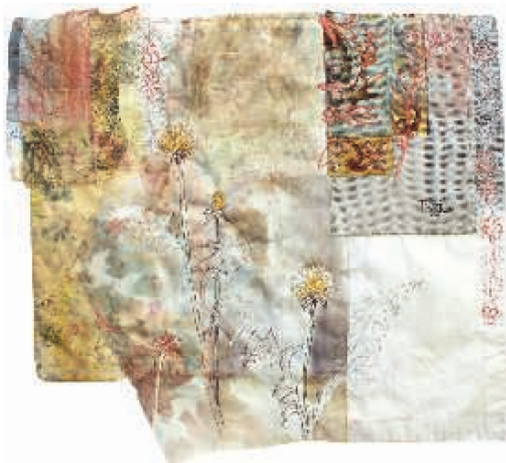
40 Cas Holmes