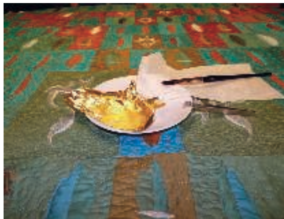
31 Pia Welsch