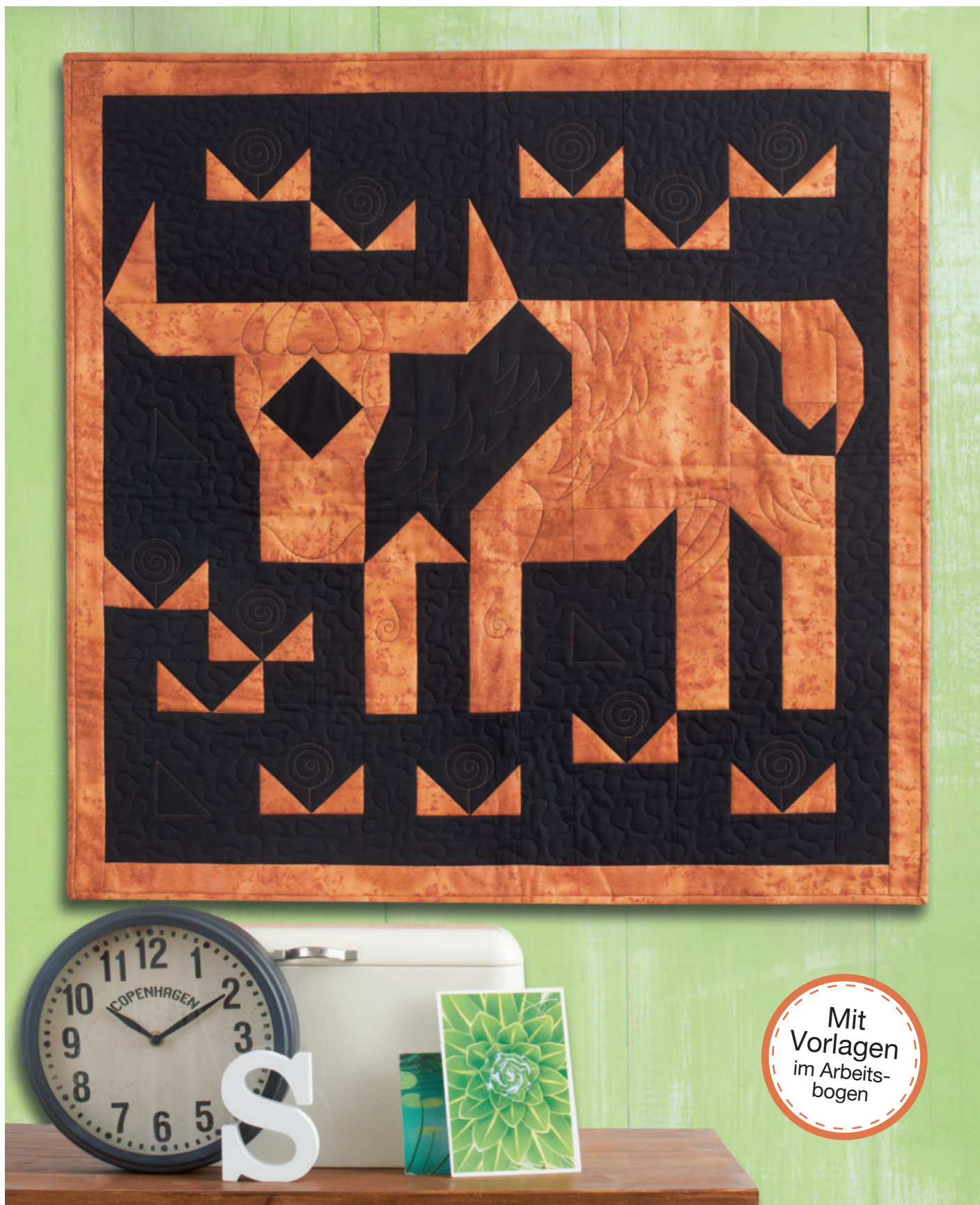
Deko: Dekobuchstabe: Rayher, Dose cremefarben: IB Laursen