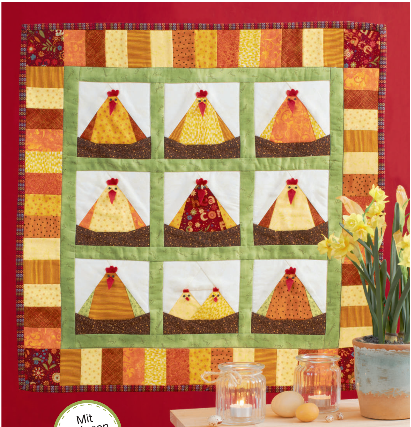
Deko: Glaswindlichter & Wachteiler / Plastik: Rayher