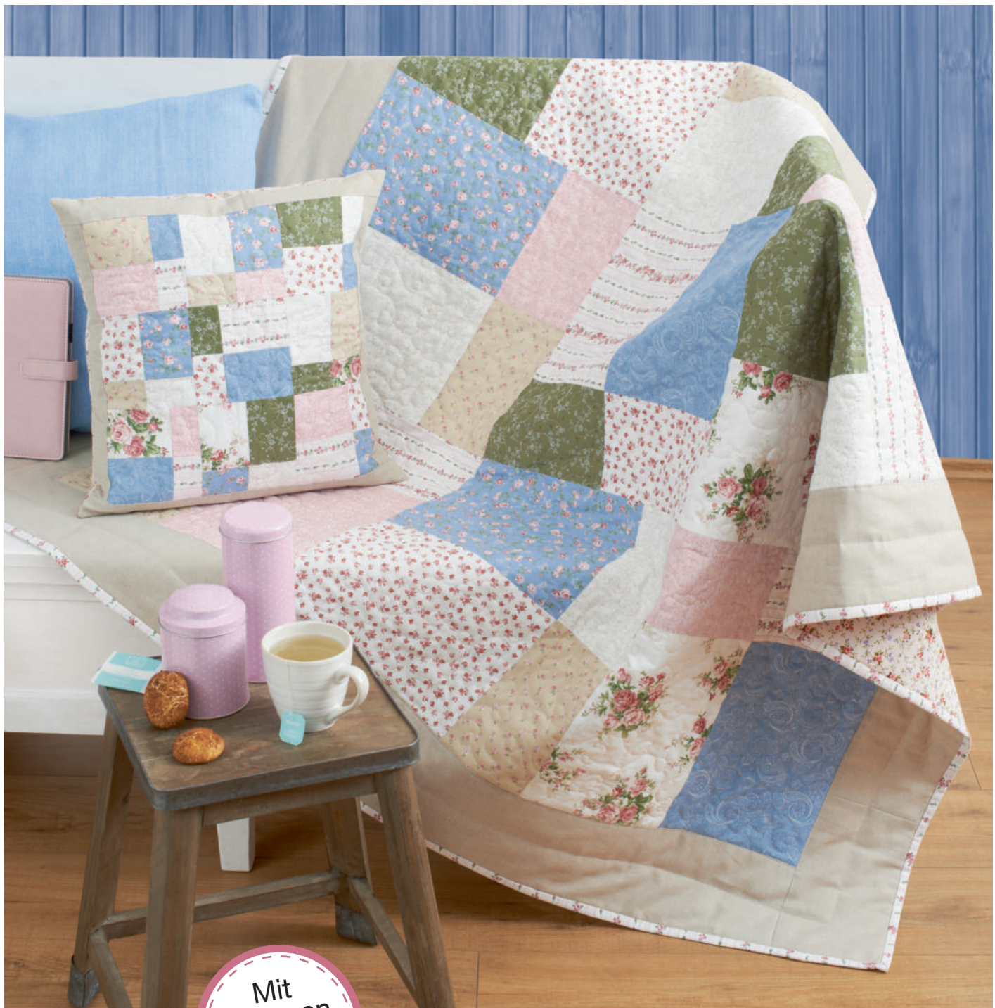
Deko: Becher: Ritzenhoff & Breker, rosa Termplaner: Rayner