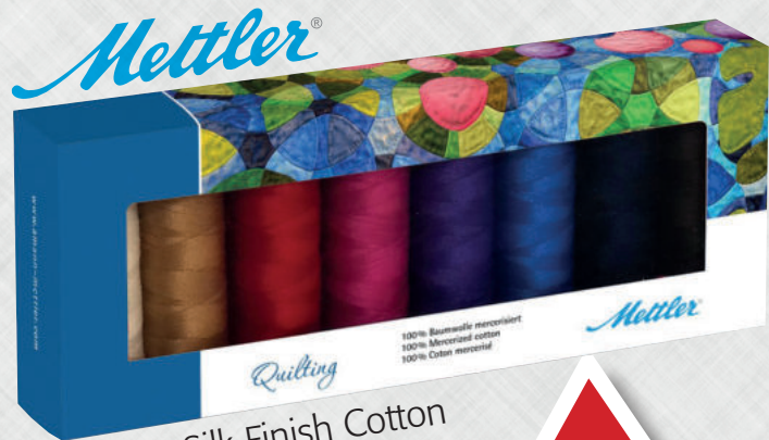
Mettler Silk-Finish Cotton Nr. 40 Quilting Kit

6 Ausgaben und Prämie nur 40,50€ (Ausland 47,70 €)