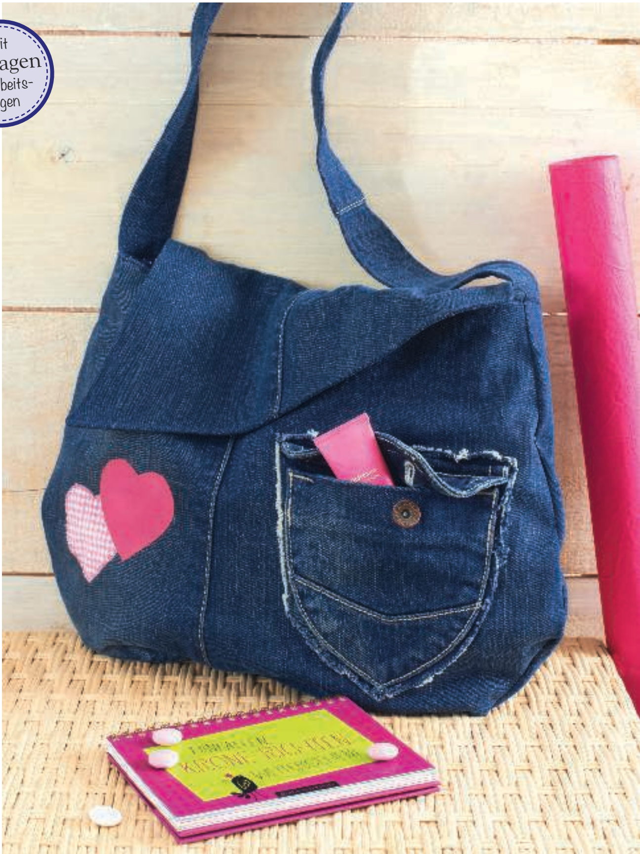
Idee, Design und Realisation: Brigitte Jung, Foto: Mirjam Anselm