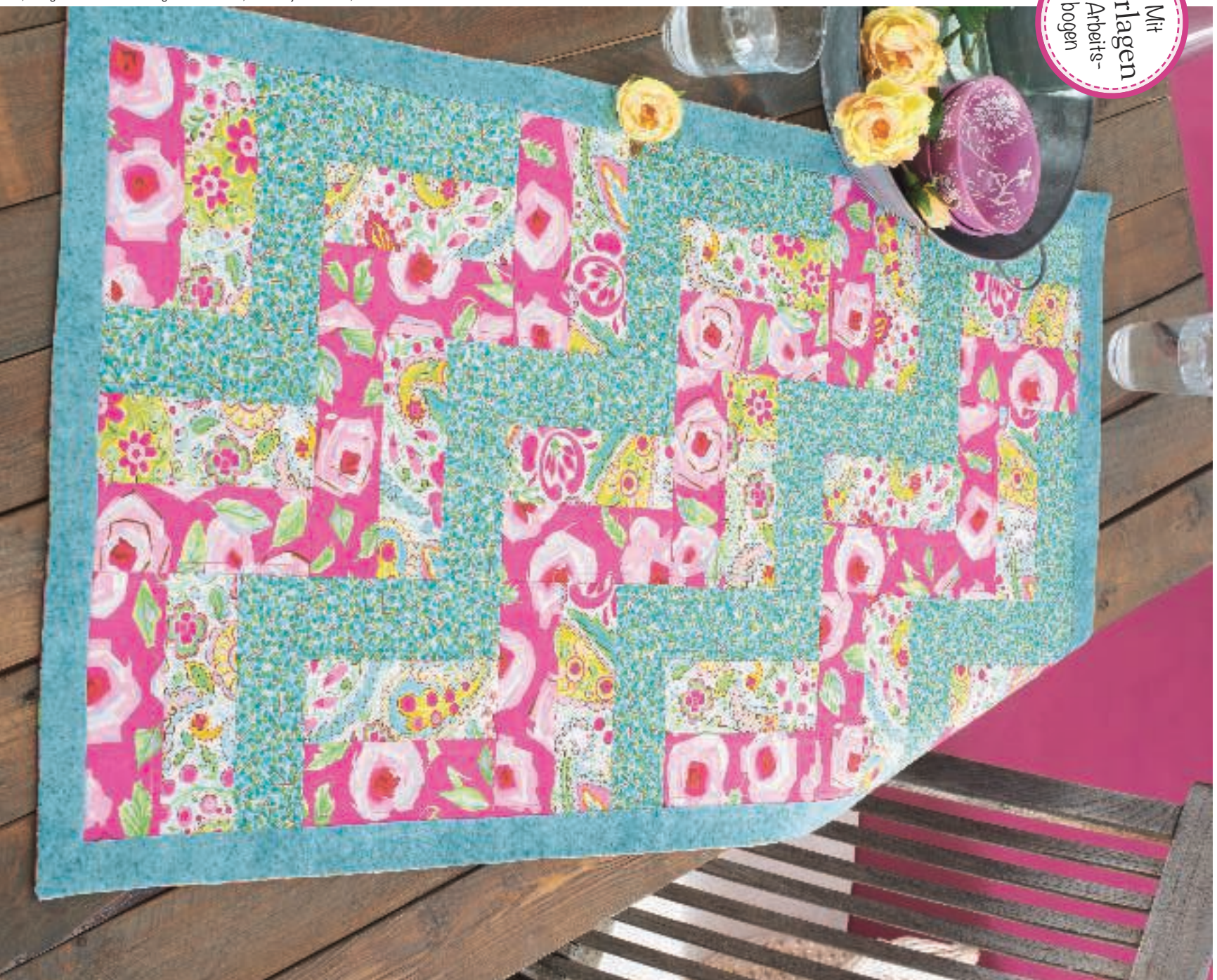
Idee, Design und Realisation: Brigitte Kretschmar, Foto: Mirjam Anselm, Deko: Zinnwanne & Tablett: IB Laursen