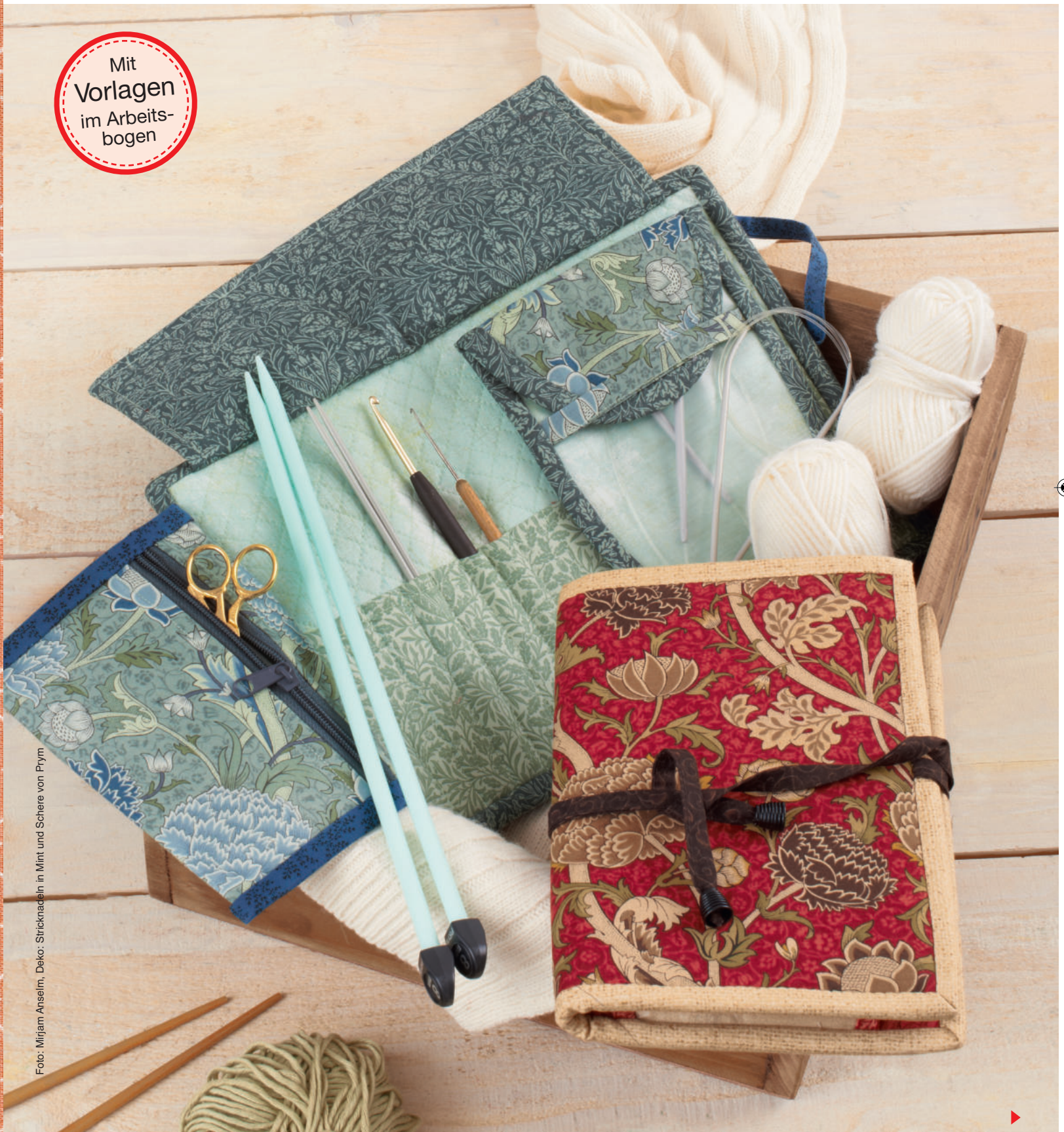
Deko: Stricknadeln in Mint und Schere von Prym