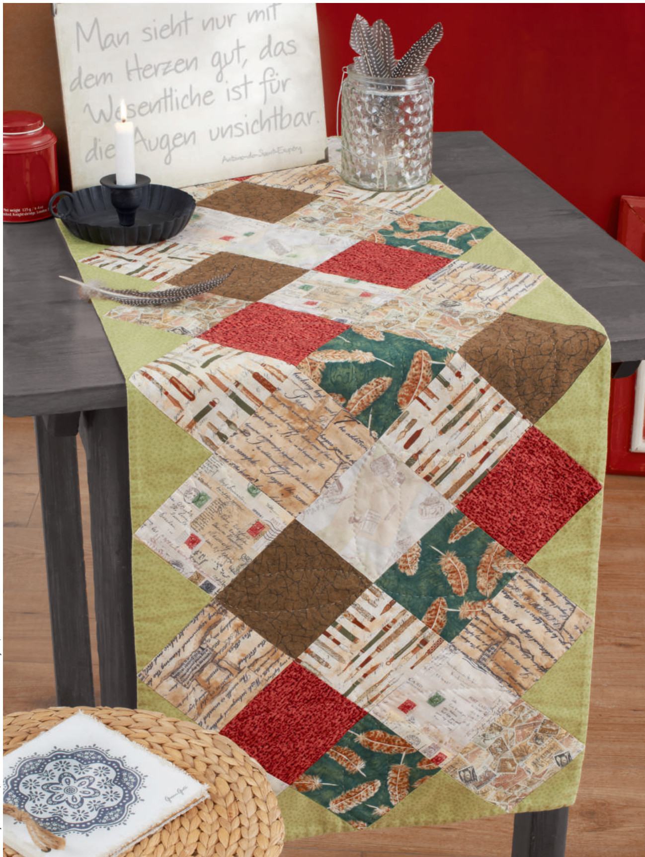
Deko: Glaswindlicht & Feder von Rayher, Kerzenständer von IB Laursen