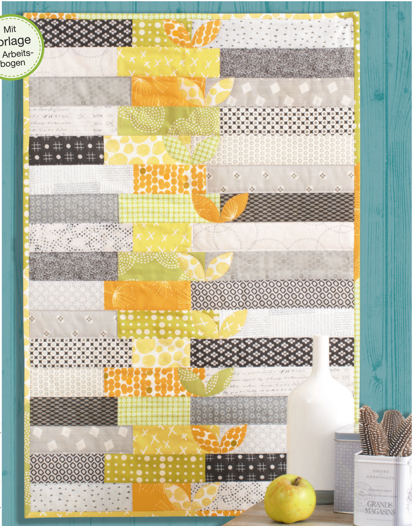
Foto: Mirjam Anselm, Deko: Federn von Rayher, Vase von Ritzenhoff & Breker