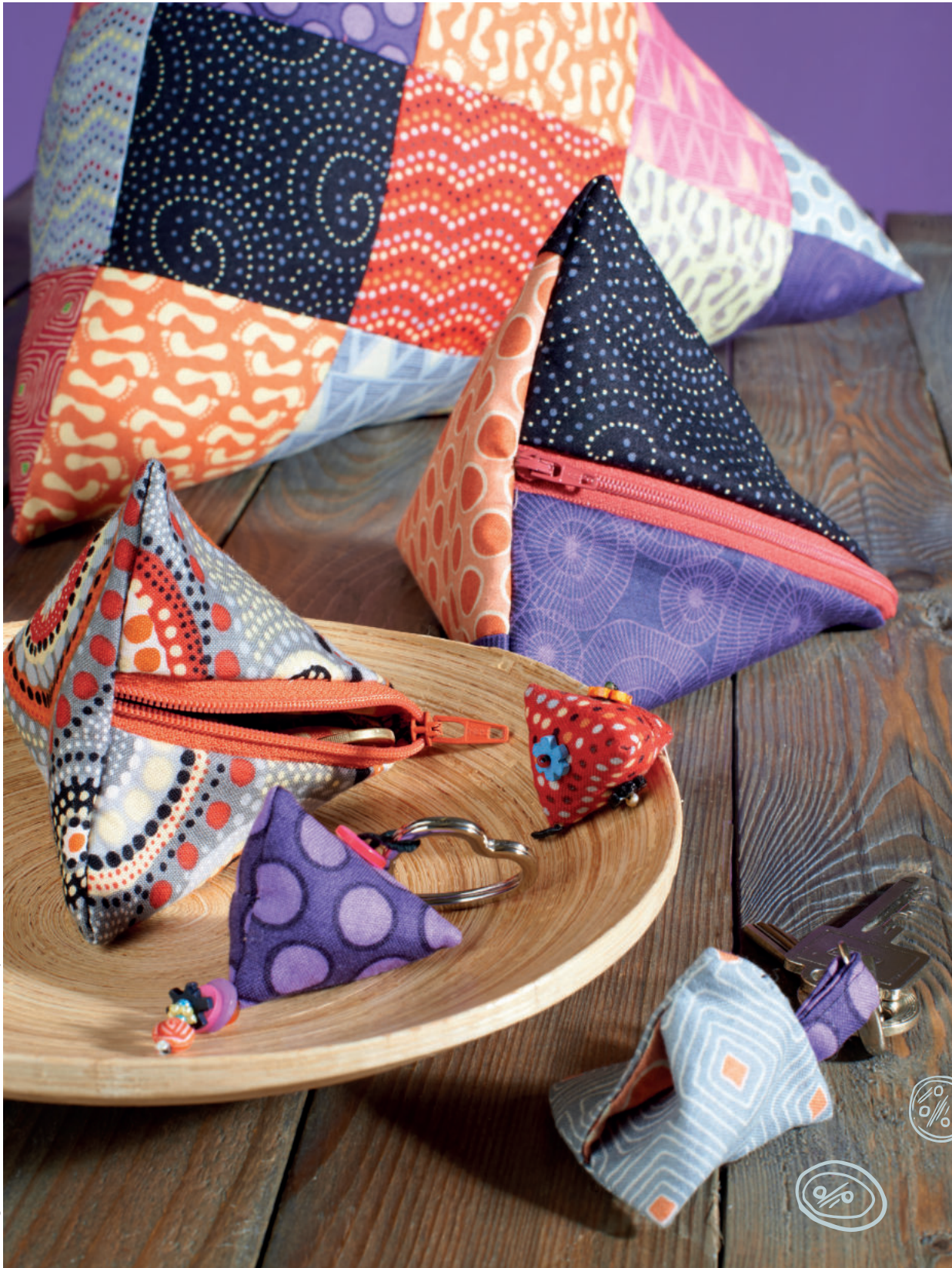
Idee, Design und Realisation: Kreativstudio

Mit der einfachen Form des Rechtecks lassen sich die unterschiedlichsten Dinge nähen. Probieren Sie es einfach mal aus – bestimmt fallen Ihnen noch ganz andere Verwendungsmöglichkeiten für diese Form ein.