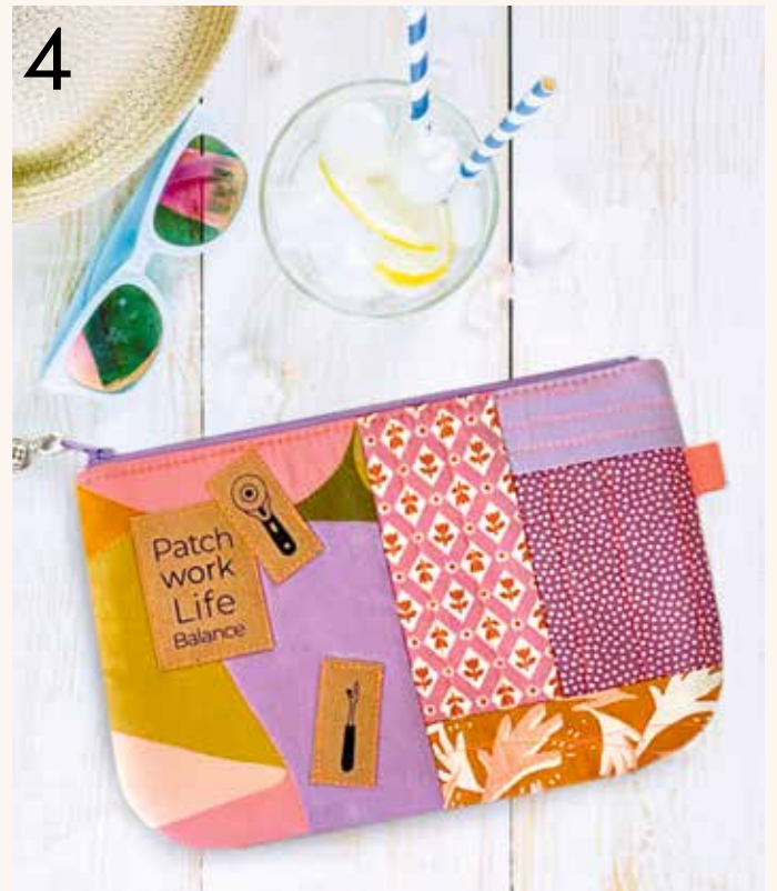
4. Quilty Pleasure Täschchen von Isabel Rahmenführer