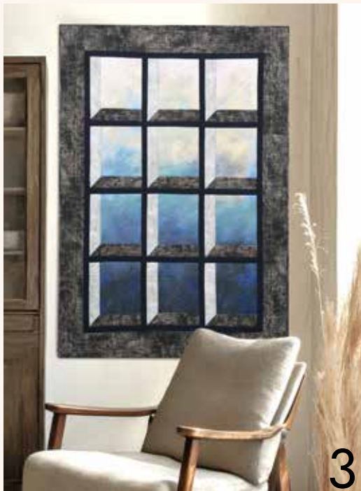
3. Nordlichter Attic-Window-Quilt von Danuta Garvs