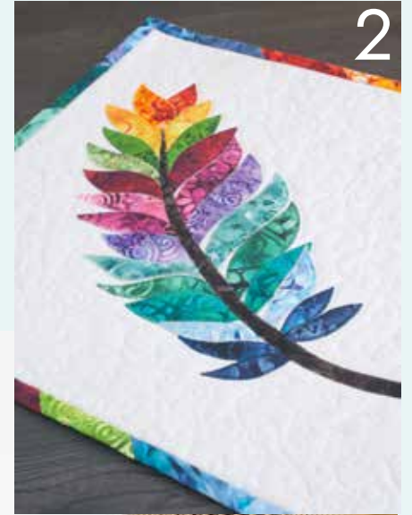
2. Rainbow Feather Appliziertes Bild von Christiane Dabrowski