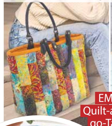
EMMA Quilt-as-you- go-Tasche

25 spannende Nähideen Alle Vorlagen in Originalgröße auf dem Motivbogen