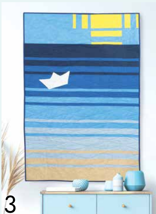
3. Ein kleines Boot im tiefen blauen Meer Strandquilt von Ariane Bott