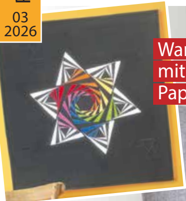
Wandbehang mit Foundation Paper Piecing

25 spannende Nähideen Alle Vorlagen in Originalgröße auf dem Motivbogen