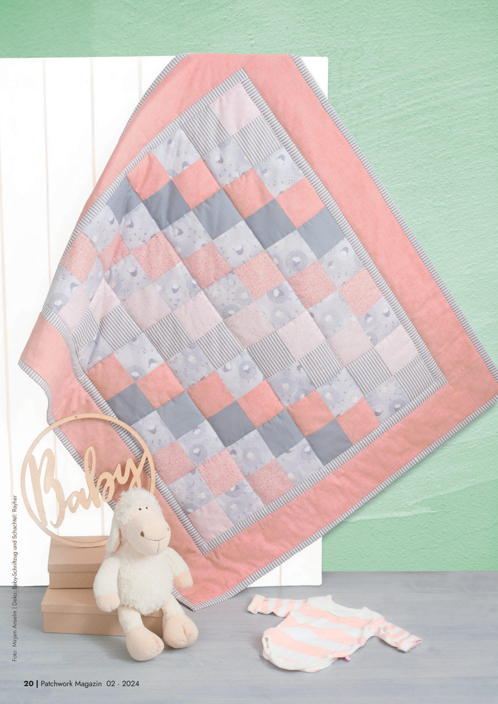
Deko: Baby-Schriftzug und Schachtel: Rayner