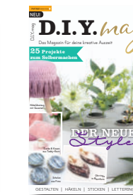
D.I.Y.mag 2/2021, 6,90 €