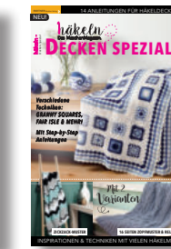
häkeln Decken Spezial 2/2020, 6,90 €