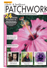
Patchwork Professional 2/2021, 9,90 €