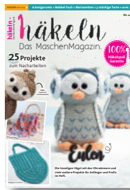
häkeln MaschenMagazin 24/2020, 5,90 €