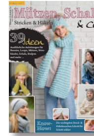
Mützen, Schals & Co. 7/2020, 6,90 €