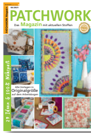
Patchwork Magazin 3/2021, 7,50 €