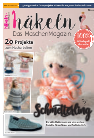
häkeln MaschenMagazin 25/2021, 5,90 €

22 Spitzen-Ideen für Tücher, Schals, oberteile & Accessoires