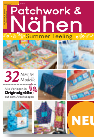
Patchwork & Nähen 3/2021, 7,90 €