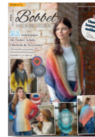
Bobbel häkeln und stricken 1/2020, 5,90 €