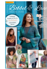
Bobbel & Lace 6/2020, 5,90 €