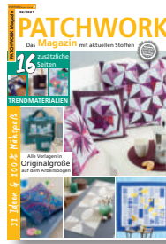
Patchwork Magazin 2/2021, 7,50 €