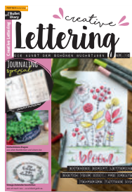
Creative Lettering 16/2020, 6,90 €