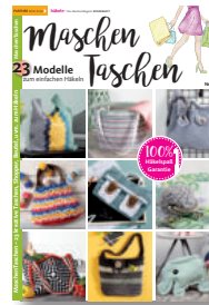
Maschen Taschen 1/2018, 5,90 €