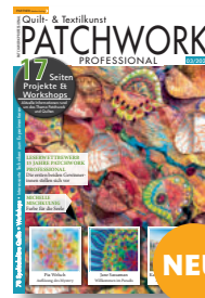
Patchwork Professional 3/2021, 9,90 €