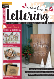
Creative Lettering 15/2020, 6,90 €