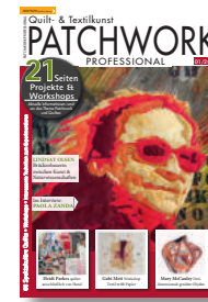
Patchwork Professional 1/2021, 9,90 €