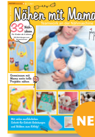
Nähen mit Mama 1/2021, 7,90 €