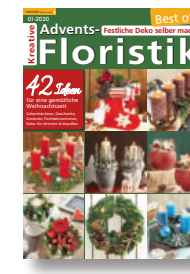
Kreative Adventsfloristik 1/2020, 4,90 €