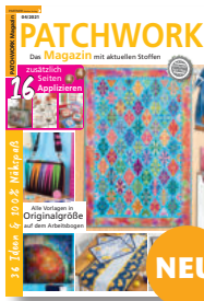
Patchwork Magazin 4/2021, 7,50 €