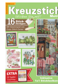
Kreuzstich Motive 23/2021, 6,90 €