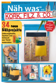
Näh was mit Kork, Filz & Co. 30/2020, 7,90 €