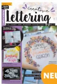
Creative Lettering 17/2021, 6,90 €