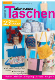
Taschen selber machen 32/2021, 7,90 €