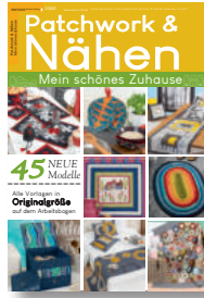
Patchwork & Nähen 2/2021, 7,90 €