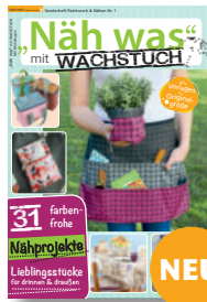
Näh was mit Wachstuch 1/2021, 7,90 €