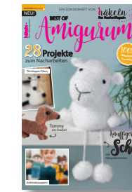
häkeln Best of Amigurumi 1/2021, 6,90 €