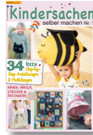
Kindersachen 1/2021, 7,90 €