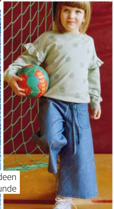
Vielseitige Jeans-Nähideen für Familie und Freunde