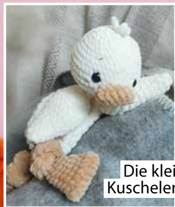
Die kleine Kuschelente